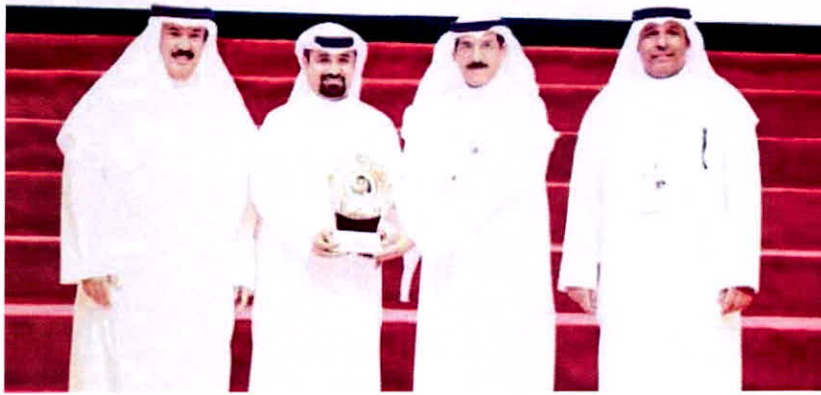
الصفق والأسناد والمكيمي يكرمون زين على رعايتها

استراتيجية الشركة للمسؤولية الاجتماعية والإستدامة، وستبقى زين دائماً في طليعة المؤسسات والشركات الوطنية الداعمة للرياضة الكويتية باعتبارها واحدة من كبرى المؤسسات الاقتصادية في الدولة، حيث تعطي المجالات الرياضية والشبابية أولوية خاصة في سلسلة برامجها الاجتماعية على مدار العام، وتعتبر قطاعي الشباب والرياضة ركناً أصيلاً في التزاماتها الاجتماعية.