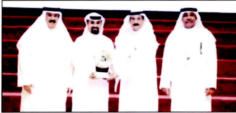
جانب من تكريم «زين»

الحدث الإقليمي الذي أتى على مستوى دول مجلس التعاون. وأضافت «زين» أن دعمها للدورة جاء من منطلق حرصها على تشجيع الجهود التي تساهم في تنمية قطاع الرياضة والشباب في الكويت، حيث تضع الشركة دعم الرياضة الكويتية في أولويات استراتيجيتها للمسؤولية الاجتماعية والاستدامة، علماً أن دعمها للعديد من أبطال الكويت كانت له ثماره في مختلف الألعاب وتمثل في العديد من الإنجازات التي تفخر بها «زين» عاماً بعد عام.