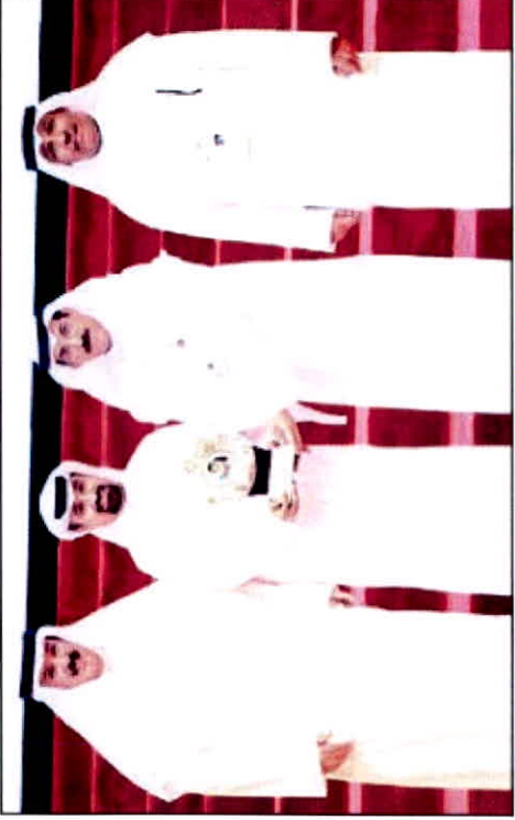
المضف والأستاذ والكاتب بكرمون «زين» على رعايتها

شملت إقامة منافسات رياضية في لعبة ألعاب رياضية وهي كرة القدم وكرة قدم الصالات وكرة الطاولة والساحة والتنس الأرضي وتنس الطاولة وألعاب القوى وإخترق الضاحية، وذلك بمشاركة أكثر من 700 رياضي من طلبة الجامعات الحكومية في الكويت والخليج العربي.